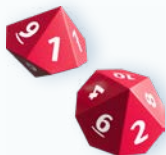
2 zehneitige Zahlenwürfel