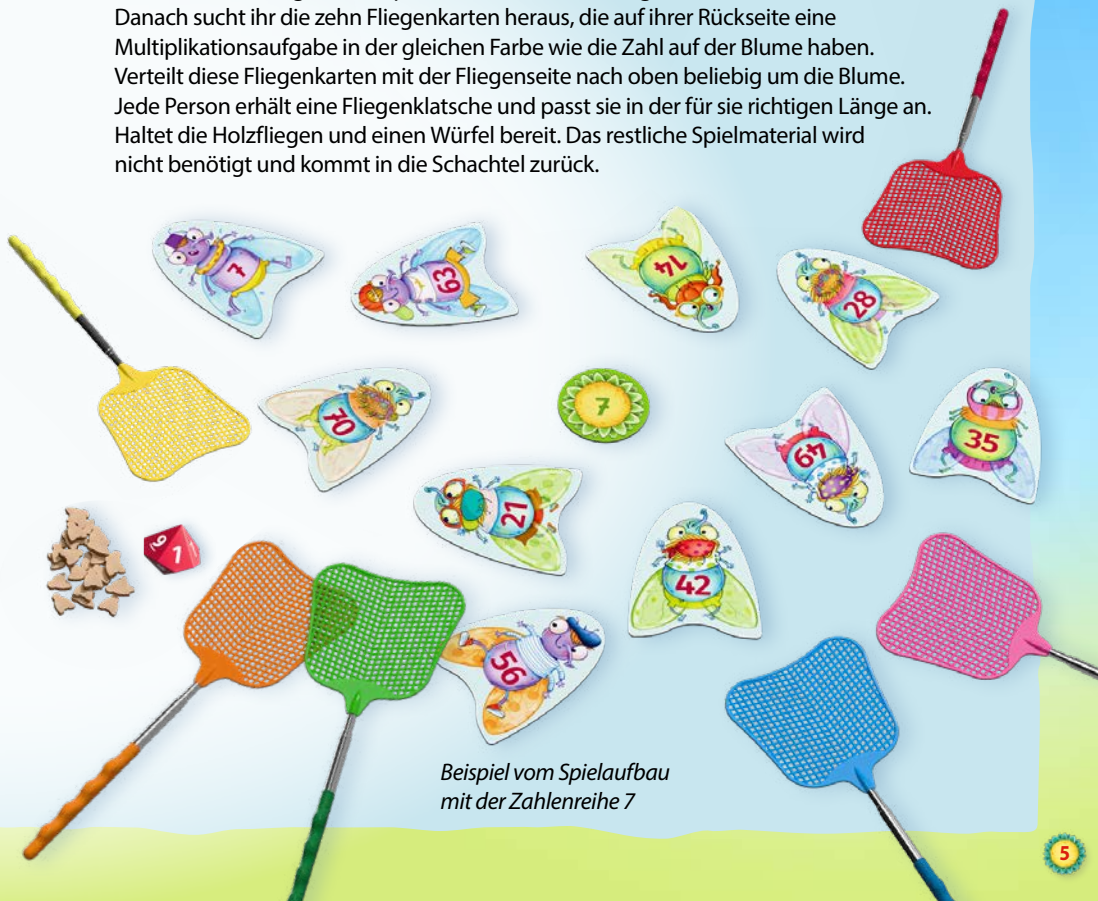
Beispiel vom Spielaufbau mit der Zahlenreihe 7

Vor dem ersten Spiel entscheidet ihr euch für eine beliebige Zahlenreihe von 1 bis 10 und legt die entsprechende Blume für alle gut sichtbar in die Tischmitte. Danach sucht ihr die zehn Fliegenkarten heraus, die auf ihrer Rückseite eine Multiplikationsaufgabe in der gleichen Farbe wie die Zahl auf der Blume haben. Verteilt diese Fliegenkarten mit der Fliegenseite nach oben beliebig um die Blume. Jede Person erhält eine Fliegenklatsche und passt sie in der für sie richtigen Länge an. Haltet die Holzfliegen und einen Würfel bereit. Das restliche Spielmaterial wird nicht benötigt und kommt in die Schachtel zurück.