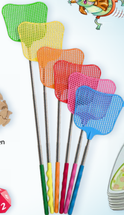
6 ausziehbare Fliegenklatschen