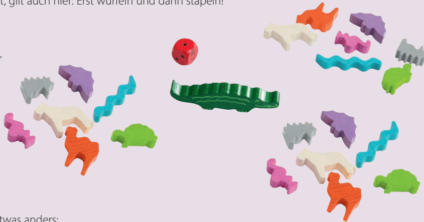
Spielaufbau für 3 Kinder