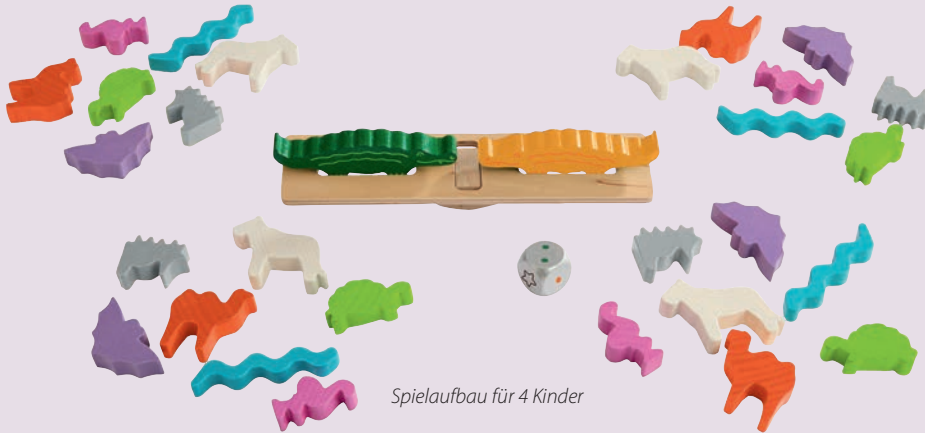
Spiel Aufbau für 4 Kinder

Jeder von euch nimmt sich nun 1 Figur von jeder Art, bis jeder 7 verschiedene Figuren vor sich stehen hat. Dies ist euer persönlicher Vorrat. Haltet den silbernen Würfel bereit. Das übrige Spielmaterial kommt zurück in die Schachtel.