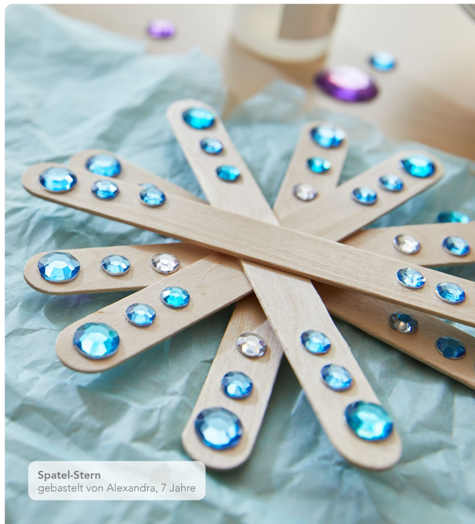
Spatel-Stern gebastelt von Alexandra, 7 Jahre

Diese Schneeflocken sind schnell umsetzbar und kommen mit wenig Materialien aus. Kinder können die Holzspatel nach ihrem Ermessen sternförmig aneinanderkleben und mit Steinen oder Stickern verzieren. Ob als Tischdekoration oder Geschenk für die Eltern – die Einsatzmöglichkeiten sind ebenso vielfältig wie die kindlichen Vorstellungen einer Schneeflocke.