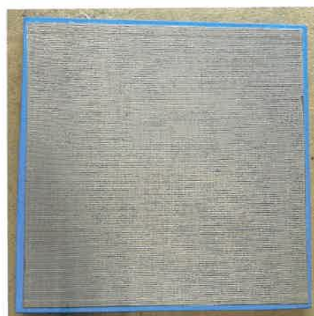
Ansicht von unten