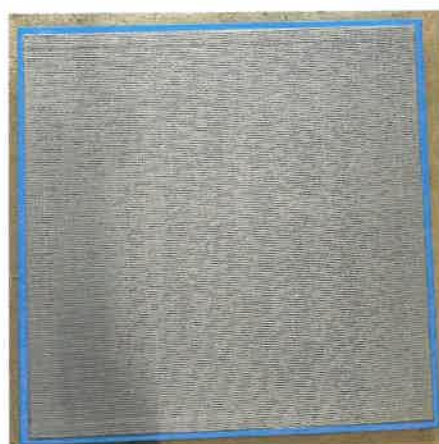
Ansicht von unten