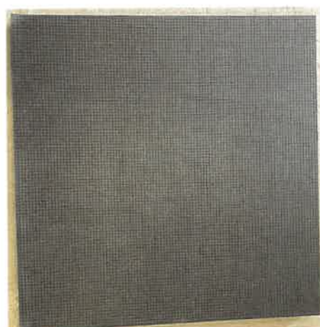
Ansicht von unten