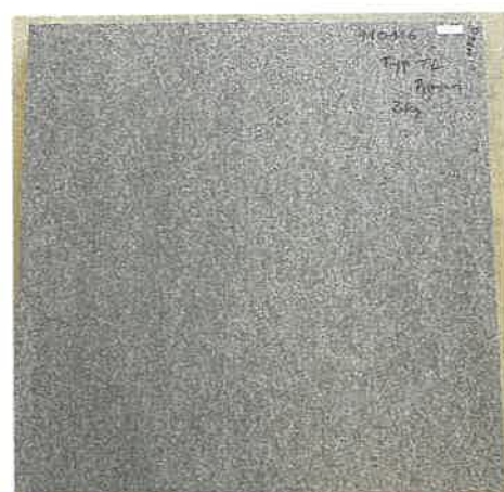
Ansicht von oben