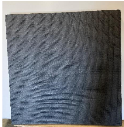
Abbildung 2: (TL Premium Rückseite)