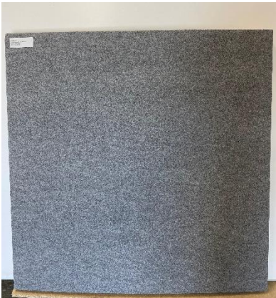
Abbildung 1: (TL Premium Vorderseite)

Produkt: Fallschutzmatten, Typen: SL, S, Ringermatte TL Premium