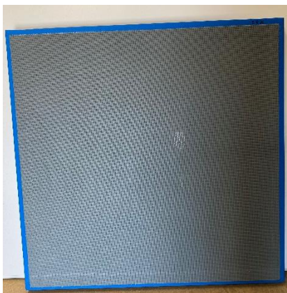
Abbildung 6: (Typ S Rückseite)