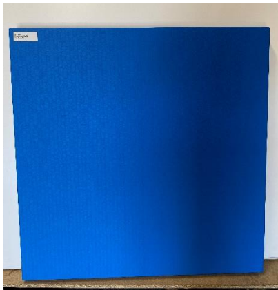
Abbildung 3: (Typ SL Vorderseite)